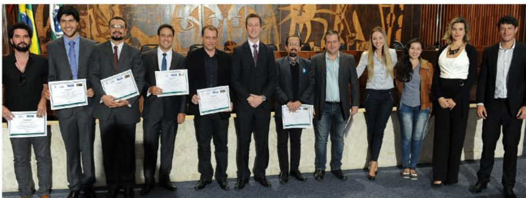
Equipe da Escola do Legislativo entrega os diplomas aos participantes do Seminário 'Poder Legislativo e Democracia Contemporânea'.