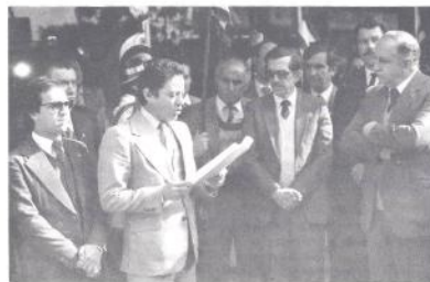
O presidente da Assembleia, deputado Trajano Bastos, discursa.

“Estamos seguros de que fortalecer o Poder Legislativo significa consolidar a democracia”. A declaração é do deputado estadual Trajano Bastos que, no desceramento da placa simbólica abençoando as comemorações dos 130 anos de Assembleia Legislativa, via repetir-se o gesto realizado pelo seu antecessor, Presidente Joaquim José Pinto Bandeira, que em 15 de julho de 1854 instalava a então Assembleia Provincial do recém criado Paraná.