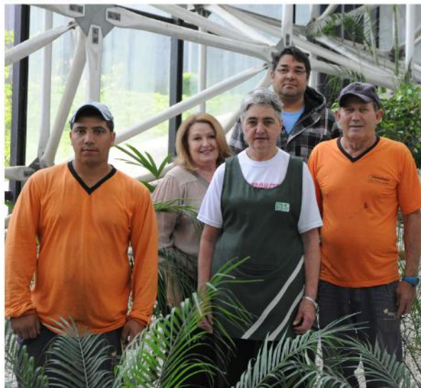
Equipe responsável pela manutenção do espaço.