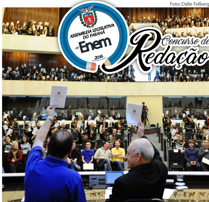
Plenário da Alep voltará a ficar lotado de alunos da rede estadual.

Mais de 48 mil alunos do Núcleo Regional de Educação (NRE) de Curitiba participarão do concurso e realizarão a prova nos colégios onde estudam. Cerca de 600 estudantes produzirão a redação diretamente no Plenário da Alep. Neste dia será realizado mais um aulão preparatório para o Exame Nacional do Ensino Médio (Enem), desta vez focado em técnicas de redação. Os autores das redações selecionadas participarão de uma sessão plenária na Casa e ainda terão as redações expostas no Espaço Cultural da Casa.